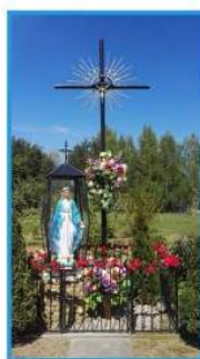
ZWYCIĘZCA II MIEJSCA W KONKURSIE "NAJPIĘKNIEJ UMAJONA KAPLICZKA" KAPLICZKA W MIEJSCOWOŚCI JAKUBÓW