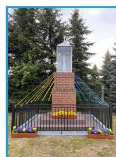
ZWYCIĘZCA III MIEJSCA W KONKURSIE "NAJPIĘKNIEJ UMAJONA KAPLICZKA" KAPLICZKA W MIEJSCOWOŚCI TUROWA WOLA